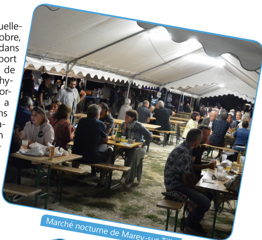
Marché nocturne de Marey-sur-Tille

Sur les cinq marchés habituellement organisés de juin à octobre, deux ont pu être maintenus dans des conditions particulières (port du masque obligatoire, sens de circulation, distanciation physique et entre les stands). L'organisation de ces marchés a permis de soutenir les artisans et les producteurs, mais également de maintenir du lien social. Toutefois, le renforcement du protocole sanitaire de cet automne ne permettait plus d'organiser d'autres événements dans de bonnes conditions. Ils ont donc dû être annulés.