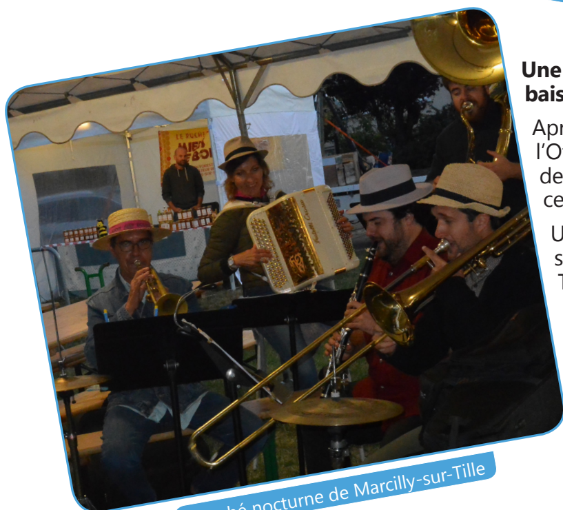
Marché nocturne de Marcilly-sur-Tille