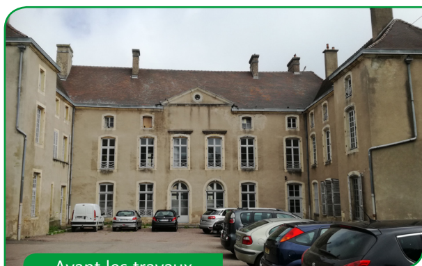
Avant les travaux