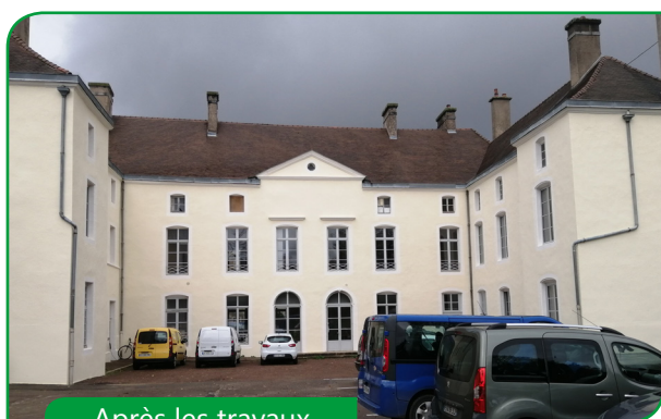
Après les travaux

Les travaux de ravalement de façade du château Charbonnel à Is-sur-Tille sont enfin terminés.