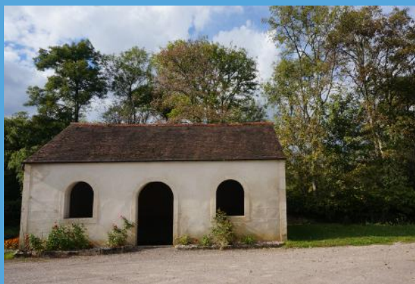
Sentier du Montaigu à Crécey-sur-Tille • 5,8 km • départ Place du Moulin

Huit sentiers sont actuellement inscrits sur le territoire de la Covati. Ils sont consultables dans le guide touristique des vallées de la Tille et de l'Ignon disponible à l'Office de tourisme, depuis le site internet www.bouger-nature-en-bourgogne.com , ou encore depuis l'application Balades en Bourgogne qui permet une promenade commentée. Ces chemins sont entretenus et balisés grâce au partenariat avec l'association Is loisirs nature .