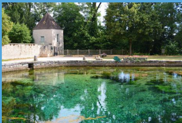
Sentier du Creux bleu à Mortière • 9,5 km • départ parking du Creux bleu

La Covati et les communes de Crécey-sur-Tille et Villecomte ont inauguré deux nouveaux sentiers inscrits au Plan départemental des itinéraires de promenade et de randonnée (PDIPR). Ces inscriptions permettent de pérenniser ces chemins et de garantir aux usagers une randonnée en toute sécurité.